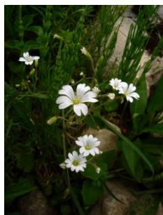
Céraiste des champs

* au soleil ou mi-ombre: céraiste, lamier maculé nain (éviter le lamier jaune galéobdolon trop envahissant), alchémille mollis;