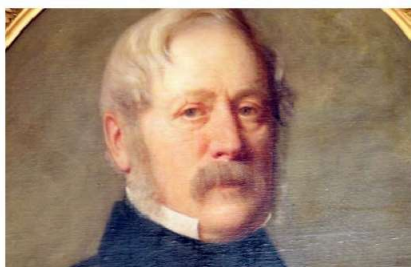
Un portrait de Samuel Demissy

► L'ouvrage Samuel de Missy (1755-1820), armateur rochelais sur l'océan Indien est disponible à la librairie Gibert. Prix : 25 €.