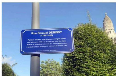
Panneau annonçant la rue Samuel Demissy à La Rochelle